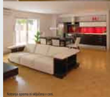
Notranja oprema ni vključena v ceni.